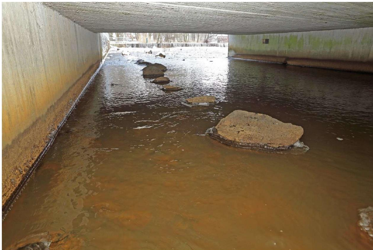
Figur 3b: Foto fra Sønderjysk vandløb af trædestensmodellen til inspiration.

Langs vandløbets modsatte side udlægges store trædesten -gerne sten som skråner ensidigt så odderen let kan komme op uanset vandstanden i åen. Det behøver ikke ligge helt så mange sten som på figur 3b, men få meter inde fra hver side lægges sten for at lokke odderen ind i røret samt et par enkelte i den midterste del af røret.