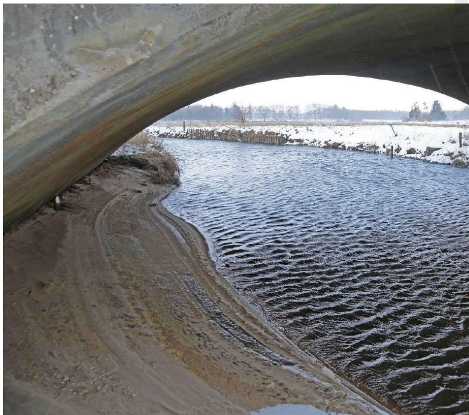
Figur 3a: Fast banket, let skrånende, til inspiration.

Odderpassagen indrettes med fast fortløbende banket i vandløbets højre side. Vintermiddelvandstanden for kommende vandløbsregulativ er beregnet til at ligge i kote 49,70-75 under broen, hvorfor odderpassagen bør anlægges i kote 49.85-49.90. Banketten anlægges så den evt. skråner let ned mod vandoverfladen (se figur 3a). Således bliver der ikke et stort niveauspring ml. banket og vandoverfladen uanset vandstand. Passagen bliver let at anvende for såvel odder som for andre arter.